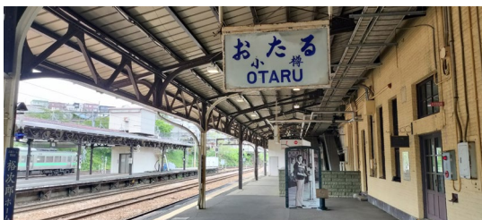
《 小樽駅4番線ホーム 》