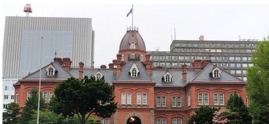
《北海道庁旧本庁舎(赤レンガ庁舎)》

財務省主税局時代に苦楽を共にした後輩二人が、昨年の異動でそろって札幌へ赴任していたこともあり、今回、お二人の激励を兼ねて訪ねたところです。