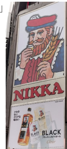
《5代目ニッカおじさん》

行動展示で全国的に知られる旭山動物園を初めて訪れましたが、展示の仕方だけでなく、動物たちの本来の行動や魅力を引き出せるよう、職員の方々がさまざまな工夫を凝らしていることを実感しました。