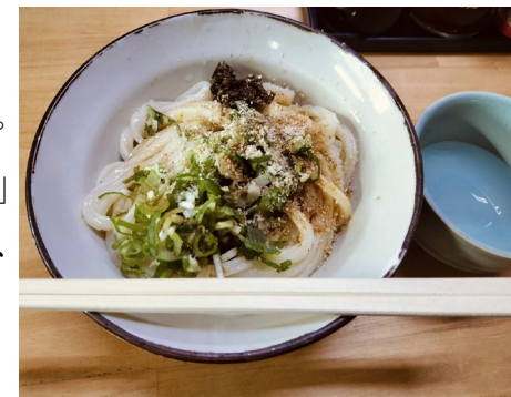
《 谷川米穀店のうどん 》

「うどん屋なのに、なぜ米穀店？」という素朴な疑問はさておき（笑）、ここでいただくのは、太めでつやのあるうどんに、ねぎ、ごま、そして青唐辛子系の薬味を添え、生醤油でいただくシンプルな一杯。これが実に美味しいのです。